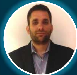
Luciano Callero Tecnología